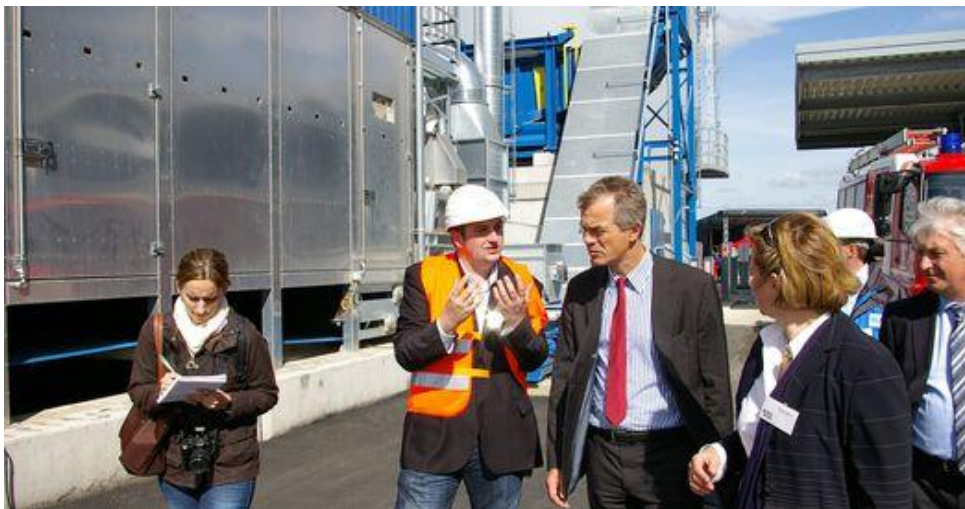
Aufbruchstimmung in der Chemischen Industrie: Die Hälfte der befragten Chemieunternehmen geht für 2011 von konstanten Beschäftigtenzahlen aus.

Der VAA rechnet für 2011 mit einer stabilen Beschäftigungslage. Ein Drittel der Chemieunternehmen will voraussichtlich neue Mitarbeiter einstellen. Dies zeigt die jährlich durchgeführte VAA- Umfrage zur Beschäftigungsentwicklung.